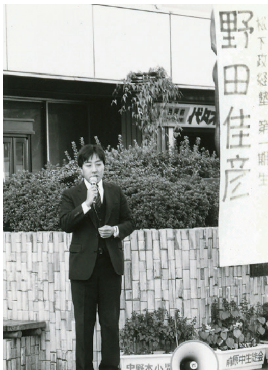
1986年、街頭に立ち始めた頃 傍らのノボリ旗は友人が手書きしてくれたもの