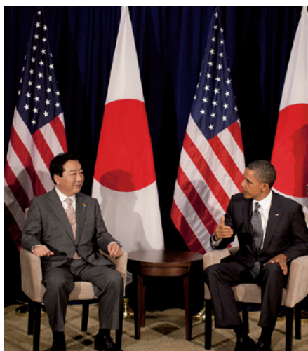
2011年11月、APECでオバマ大統領と

38年にわたり、駅頭や集会でお聞きした国民の声を結集し、日本の政治改革、世界の平和に真剣に取り組んできました。