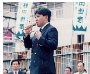
1993年、衆議院議員選挙に 日本新党より立候補し、初当選