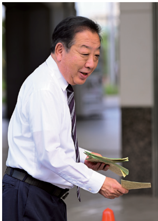
2024年、初めて街頭に立ち始めてから38年 いまま変わらず街頭活動はつづいている