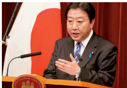
2011年11月、首相官邸にて