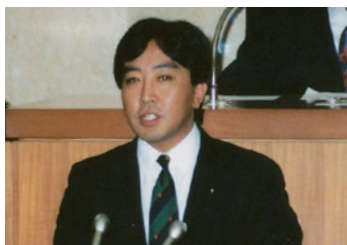
1987年、千葉県議会にて その後、千葉県議を2期務めた